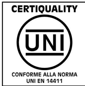
Fig. 2 - Immagine del Marchio Certiquality-UNI/CEN KEYMARK