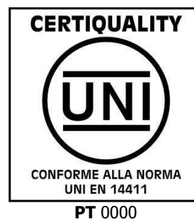
Fig. 2 - Immagine del Marchio Certiquality-UNI/CEN KEYMARK